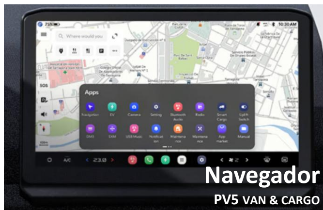
Navegador PV5 VAN & CARGO

*Compatible con: Iphone, Apple watch, y Android Smartphone (Samsung y Google Pixel). Consulta compatibilidades en nuestra web.