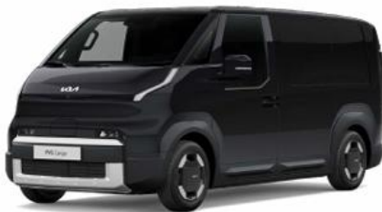
ABP-Aurora black pearl