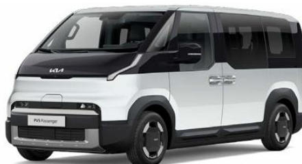
SWP-Snow White pearl