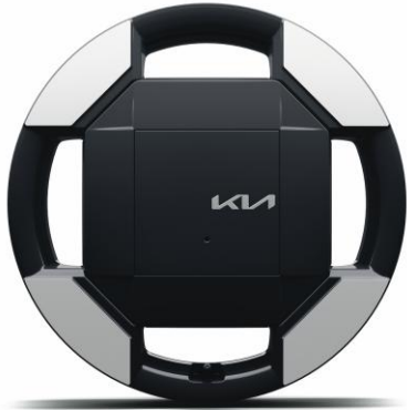
Llanta de aleación 16"