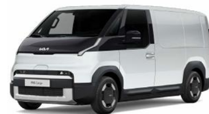
SWP-Snow White pearl