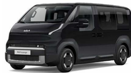
ABP-Aurora black pearl