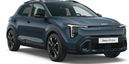
EU3 - Smoke blue