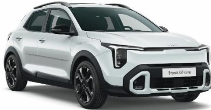
SWP - Snow white pearl