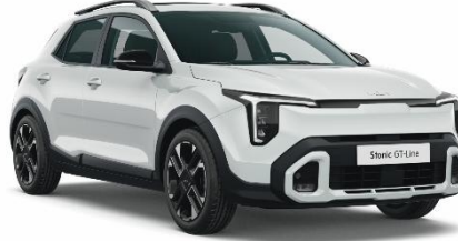
UD - Clear White *