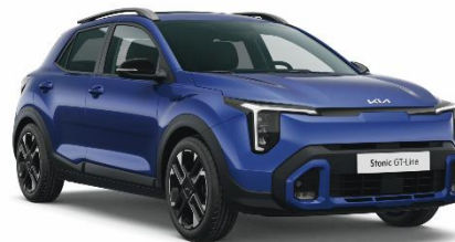
DU3 – Yatch blue