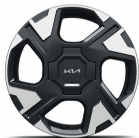
Llanta de aleación 16"