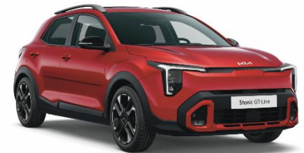
BEG - Signal red