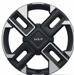
Llanta de aleación 17"