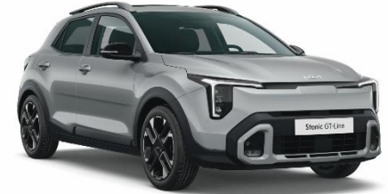
KCS - Sparkling Silver