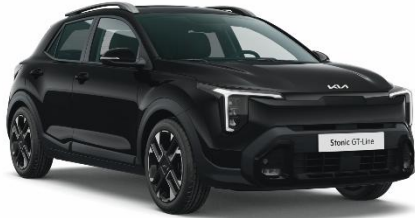
ABP - Aurora black