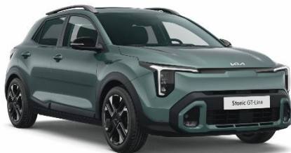
A2G – Adventurous green