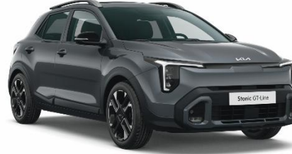
M7G - Astro gray