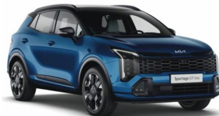
HA8 - Blue flame