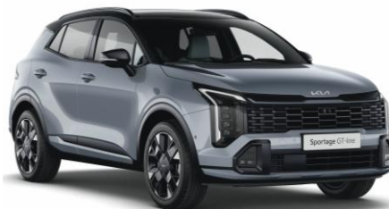
HA5 - Lunar silver