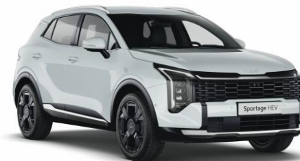
WD - Cassa white *