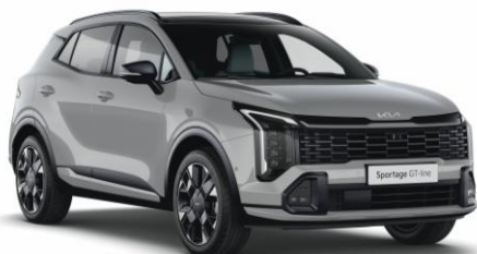
WAF – Wolf Grey