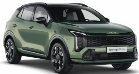
HBC - Experience green