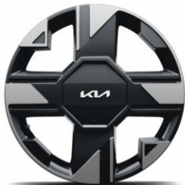
Llantas de aleación de 17" (ACTIVE)