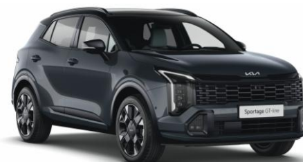
HA6 - Dark penta metal