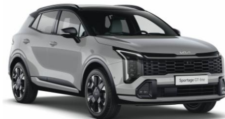
HBM – Wolf gray