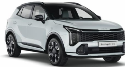
HA3 - Cassa white