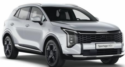
HW2 - Deluxe white