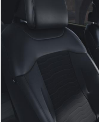
Tapicería en TEJIDO y PIEL