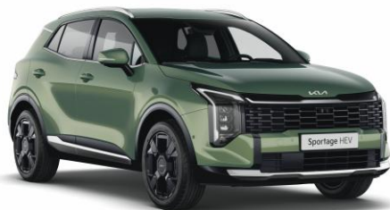
EXG - Experience green