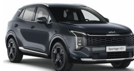
H8G - Dark penta metal