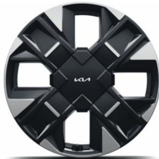
Llantas de aleación de 19" (GTLINE)