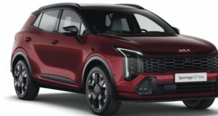
ARD - Magma red