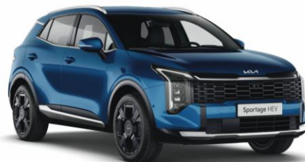
B3L - Blue flame