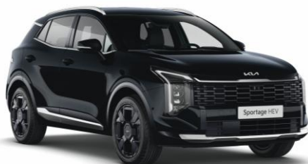
1K- Black pearl