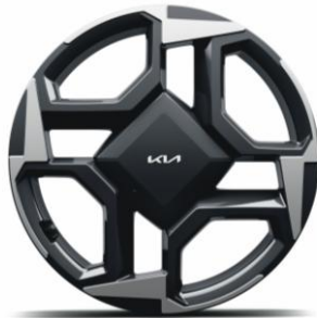
Llantas de aleación de 18" (TECH)