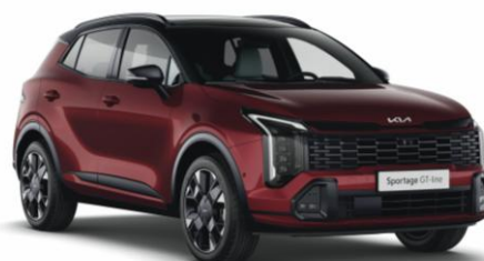
HBR - Magma red