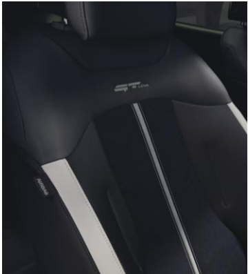
Tapicería en PIEL y ANTE