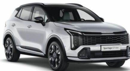
HA2 - Deluxe white