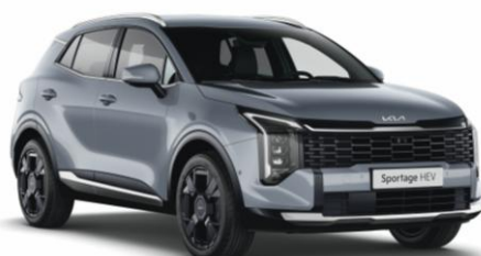
CSS - Lunar silver