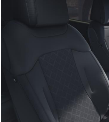
Tapicería en TEJIDO