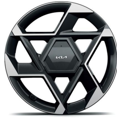
Llanta de aleación de 19"