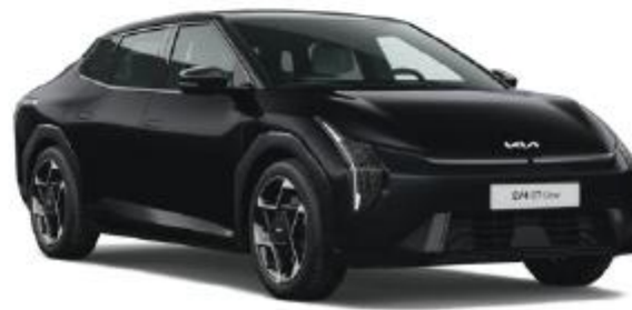
ABP-Aurota Black Pearl