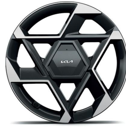
Llanta de aleación de 19"