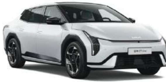
SWP-Snow White Pearl