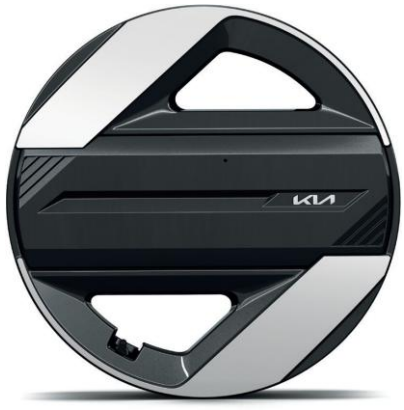
Llanta de aleación de 17"