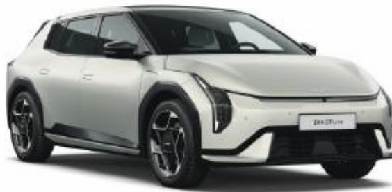
IS4-Ivory Silver Matte