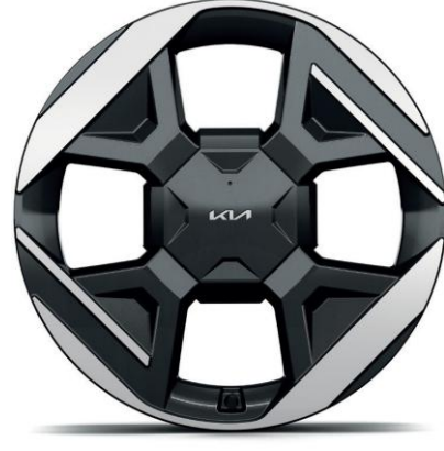
Llanta de aleación de 19"