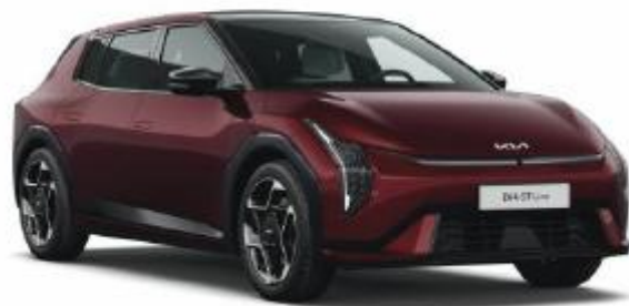
ARD- Magma Red